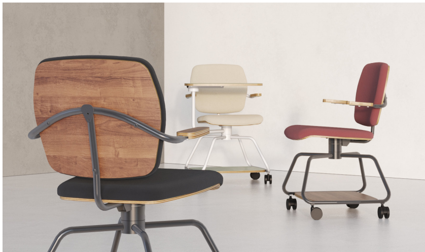
*Imagens meramente ilustrativas.